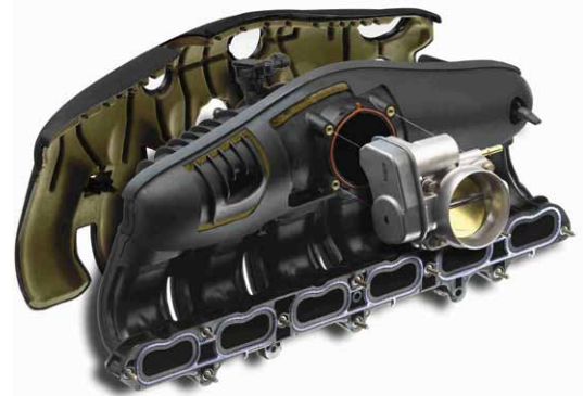
Ansaugtrakt in einem Motor

„CFX Berlin war da, als wir die Dienstleistung benötigten, obwohl alles praktisch von heute auf morgen erledigt werden musste.“