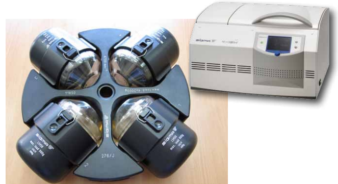
Laborzentrifuge der Firma Sigma